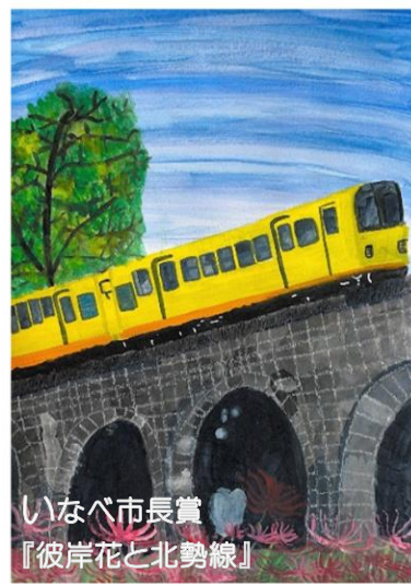
いなべ市長賞 『彼岸花と北勢線』