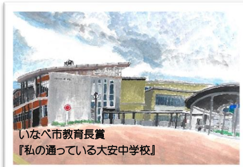
いなべ市教育長賞 『私の通っている大安中学校』