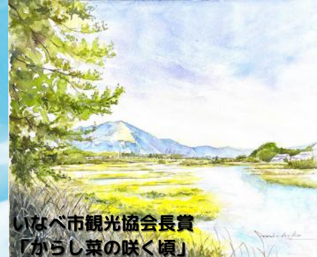
いなべ市観光協会長賞 「からし菜の咲く頃」