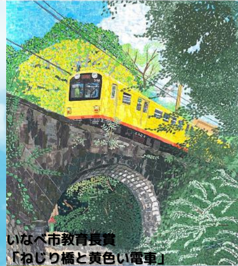
いなべ市教育長賞 「ねじり橋と黄色い電車」